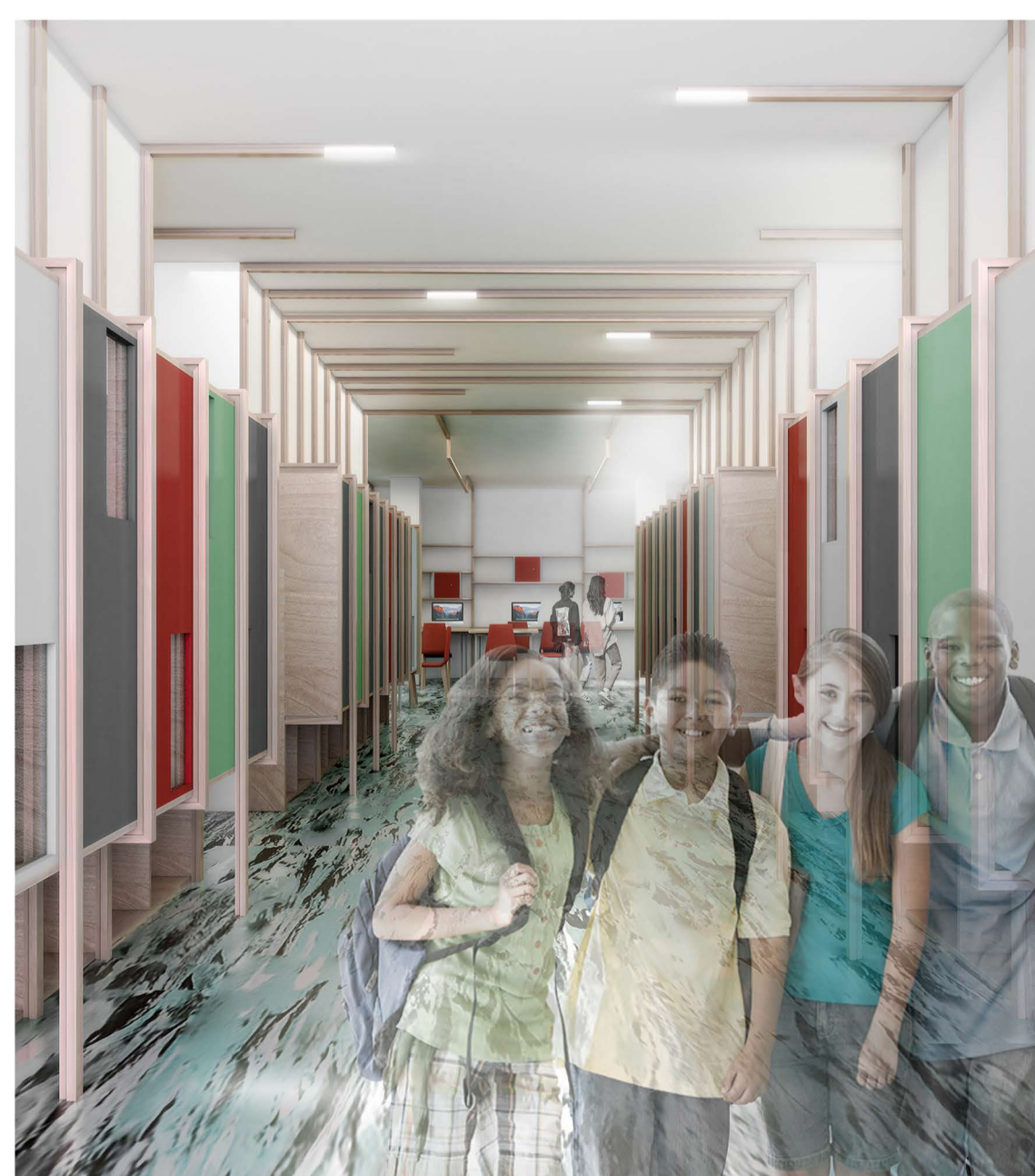
VISTA DAL GUARDAROBA VERSO LO SPAZIO COMUNE