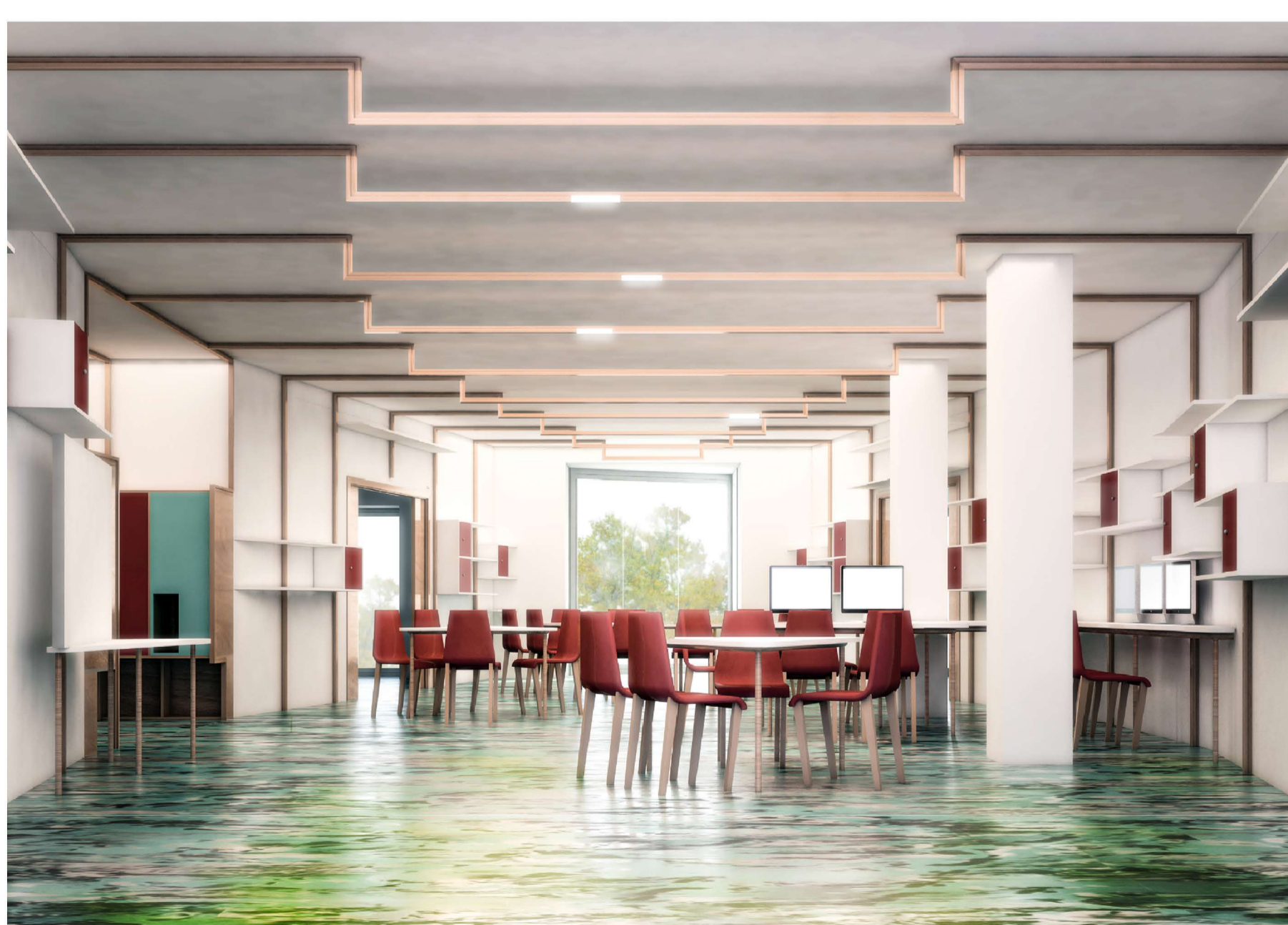
VISTA DELLO SPAZIO COMUNE DEL CLUSTER