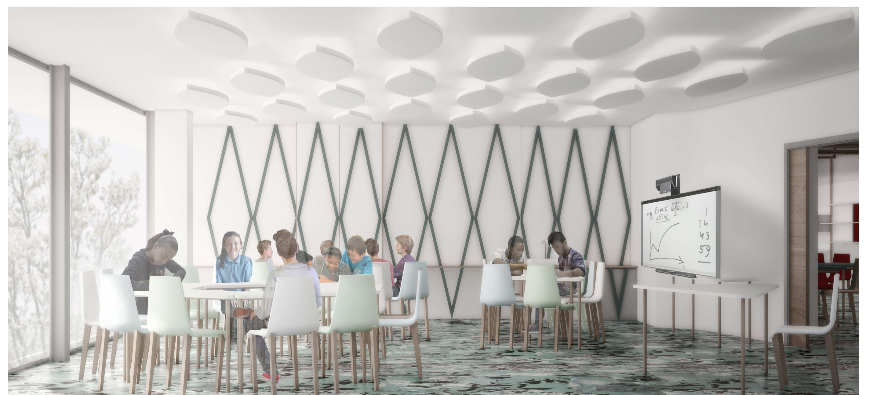
VISTA INTERNA DI UN'AULA